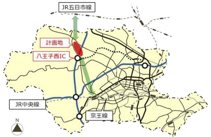
(八王子市内位置図)